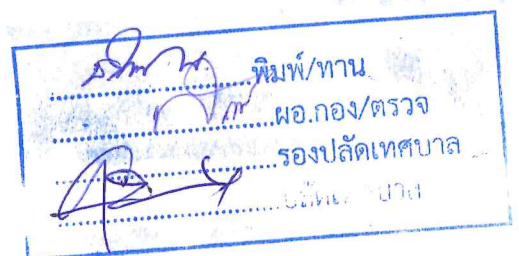
นายสนธิ์ ดวงภักดี นายกเทศมนตรีตำบลบ้านโคก

ประกาศ ณ วันที่ ๑๘ เดือน ธันวาคม พ.ศ. ๒๕๖๖